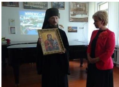
Гимназия № 15 г. Минска. 1 сентября 2017 года. Гостевой урок «Минску – 950! Духовность. Нравственность. Традиции»

30 сентября 2017 года в рамках реализации соглашения о сотрудничестве между Синодальным отделом религиозного образования