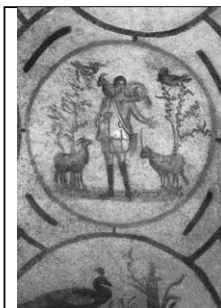
Рисунок 1. Изображение Доброго Пастыря

Сколько слов можно сказать об этом изображении! А ведь эта небольшая часть росписи одной из многочисленных римских катакомб является лишь одним из красочных мазков на необъятном полотне мировой религии. Она – лишь небольшой элемент, принадлежащий периоду становления, когда христианство только начинало подбирать слова, чтобы донести свое послание людям всего мира. Это слова о доброте и добродетелях, о смирении, упорстве, трудолюбии, правде, о святости, о силе духа, о воли, терпении, радости, сопереживании, неравнодушии, сочувствии, решимости и вере.