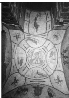
Рисунок 3. Роспись потолка катакомб святой Присциллы