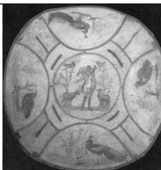
Рисунок 2. Фрагмент росписи потолка катакомб святой Присциллы